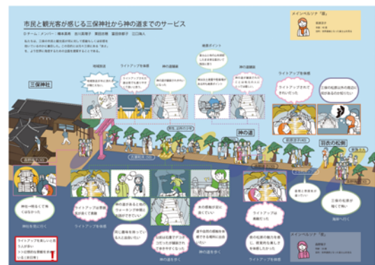
顧客の体験地図 (カスタマージャーニーマップ) 例