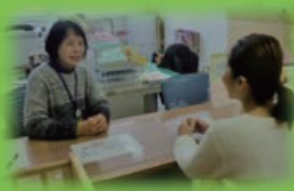
子育てコンシェルジュ