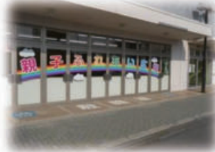
親子ふれあい広場