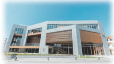
ターントクル子ども館