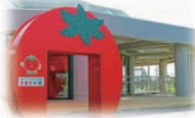
ターントクル子ども館とまとぴあ