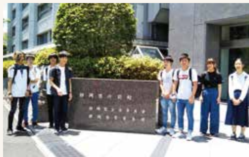
教養セミナー・フィールドワーク(静岡県庁別館前2018年6月)

2013年4月からスタートしている法学部について、より多くの方にその特長や詳細を知っていただくためのセミナーです。当日はコースの紹介、カリキュラム、キャリアサポート、公務員試験対策講座等について、詳しくご説明します。特に公務員試験対策講座、キャリアサポートについては、専任講師と担当教員から直接ご説明いたします。