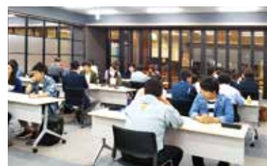
藤枝市との地域課題解決事業(2018年5月)