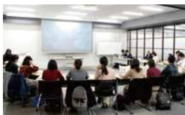
若者に魅力のある事業@藤枝(2017年)