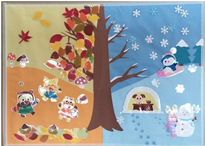
病院を彩り、子どもを笑顔に！～秋から冬へ