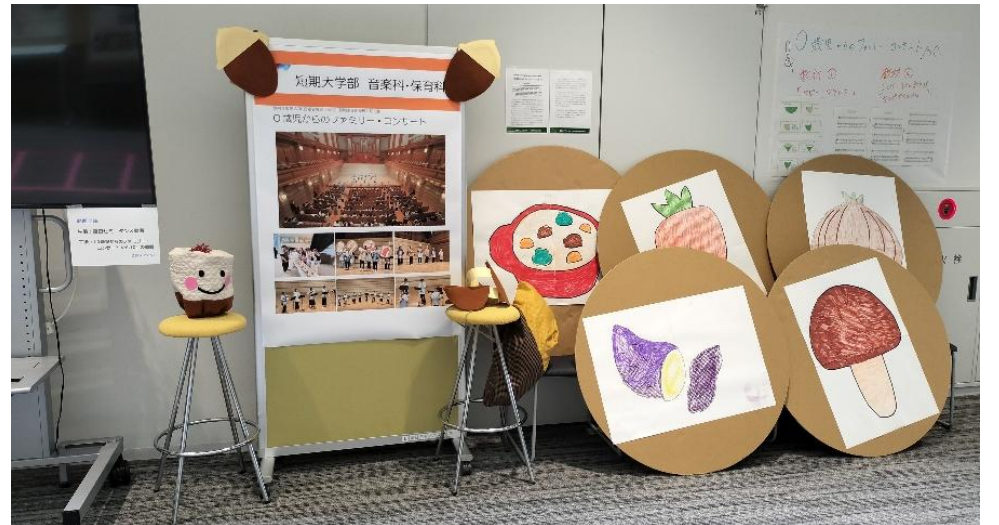
0歳児からのファミリー・コンサート (コンサートの動画とコンサートで使用したアイテムを展示しました)