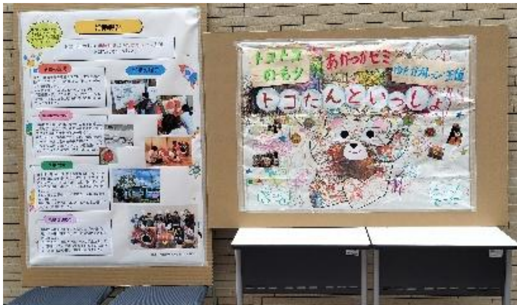
トコトコの森 赤塚ゼミ