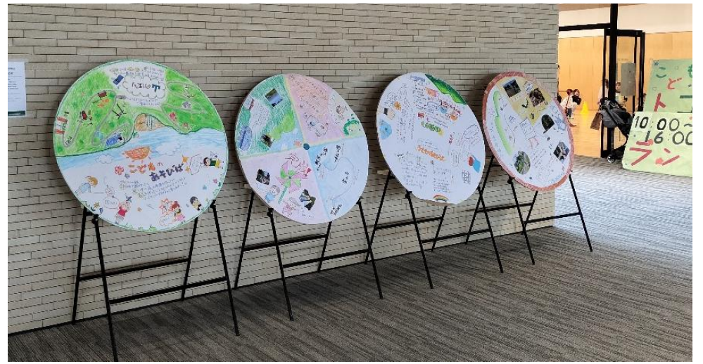
「自然」を受け取る 自然にあらわす