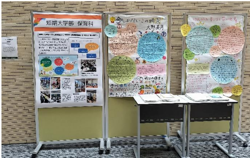
「子ども学概論」の授業紹介