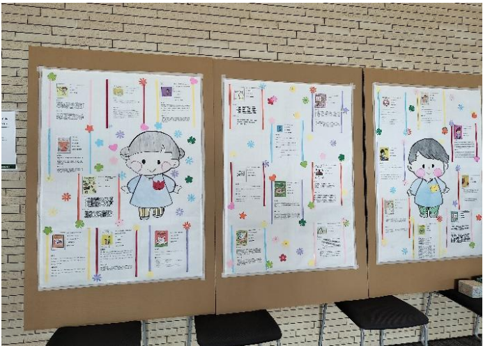
子どもと一緒に学ぶ絵本