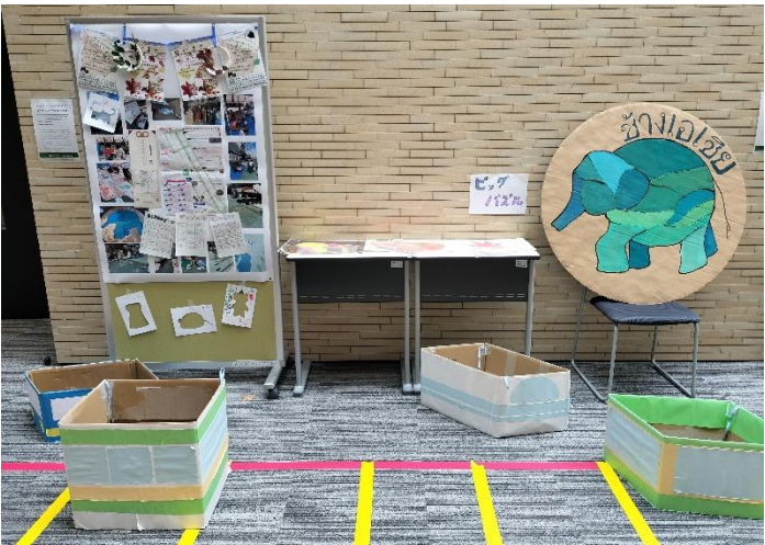
長政まつり「トコたん子どものあそびば」