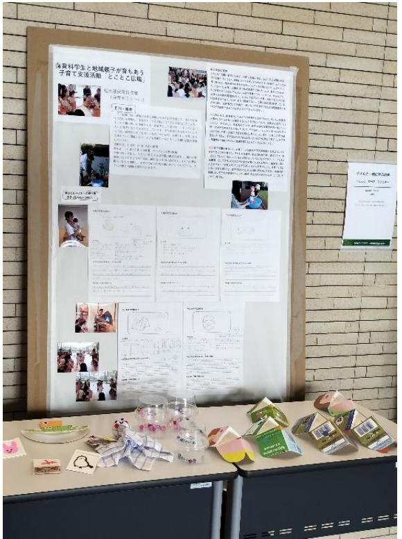
「とことこ広場」実践報告