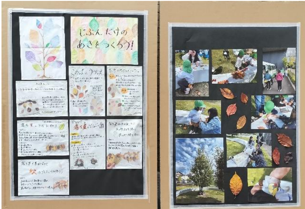
トコトコの森 落ち葉であそぼう