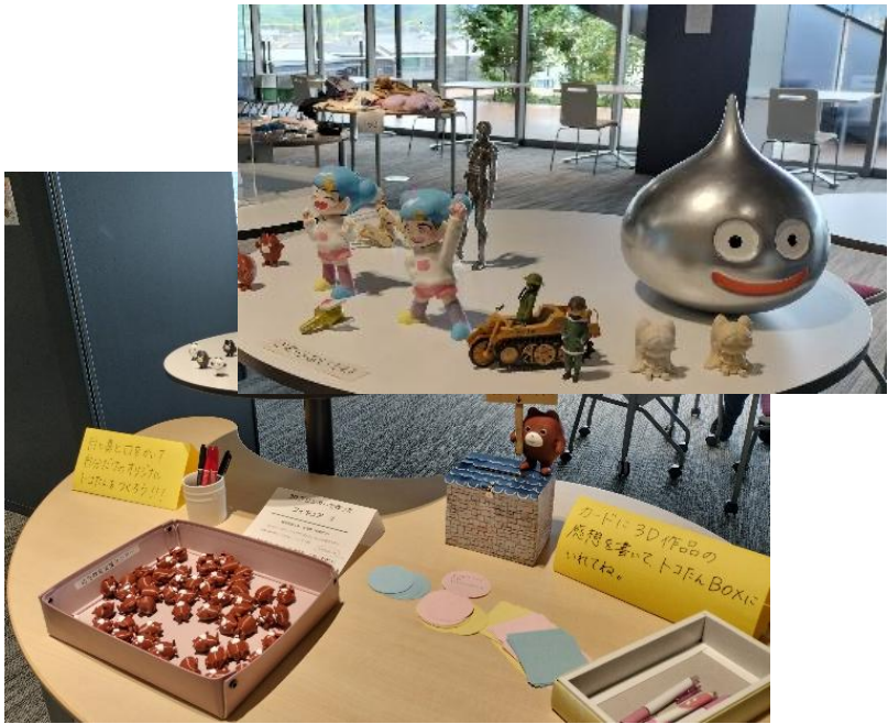
3D プリンターで作ったフィギュア (ミニトコたんをプレゼントしました)