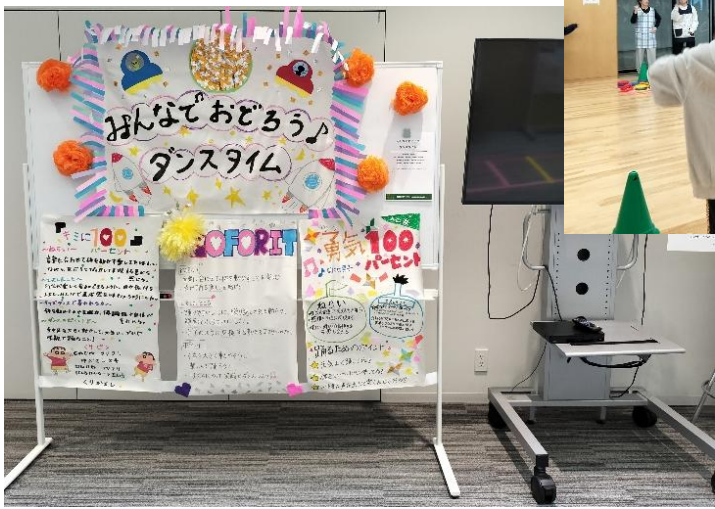
みんなでおどろう！ダンスタイム！ (ダンス動画と実演も披露しました)