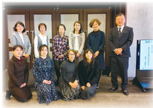
総会を運営した同窓会役員と大学の担当者です。

世界遺産「富士山本宮浅間大社」(専門ガイドの案内付き) 〈昼食／富士ビューホテル フレンチコース料理〉