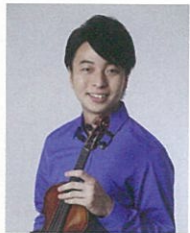
岡本誠司 第19回国際バッハ・コンクール ヴァイオリン部門第1位