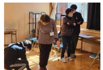
一日目の測定の様子