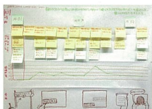
体験マップが完成します