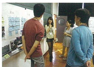
ワークショップのイメージ

僕は走るのが得意だったから、中学では陸上部に入りました。部活がない時も一人で走っていたのは、蓮華寺公園です。中年の男性と何度か同じ方向で走っていたのですが、11月の曇りの日曜にランニングしていると、その人がベンチでコーヒーを入れながら笑顔で誘ってくれました。聞くと、神奈川から引っ越してきて、郊外でギャラリーカフェを開いたそうです。ジョギングにいいコースや、趣味の写真の話や、美味しい豆の話を知ると、何だか自分が大人になった気がして、とてもいい時間でした。